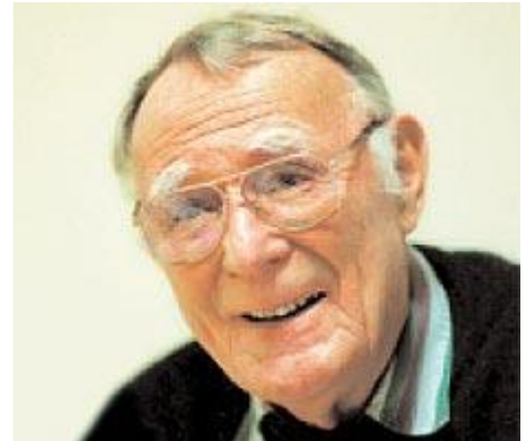
Основатель IKEA Ингвар Кампрад

Предлагаемая продукция имела четкие дифференцирующие черты. Все было простым, качественно сделанным, по-скандинавски элегантным. Все продавалось в разобранном виде для самостоятельной сборки покупателями, что снижало цену и срок доставки из магазина (чем отличаются другие мебельные фирмы). Огромные пригородные магазины имели огромные парковки, рестораны, детские игровые комнаты, инвалидные кресла и т.п. Покупатели ожидали стиля и качества по разумным ценам. IKEA реализовала эти ожидания, предоставляя покупателям возможности самостоятельного создания ценности путем исполнения функций, традиционно отдаваемых производителю или продавцу: например, доставка и сборка. Разумеется, это также снижало издержки. Также на это работало и то, что покупателям в торговом зале выдавались бумажные «метры», карандаши и блокноты для записей – требовалось меньше продавцов.